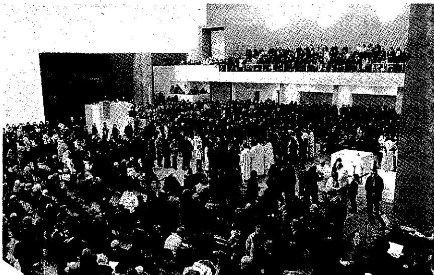
La chiesa gremita per la messa di mezzanotte